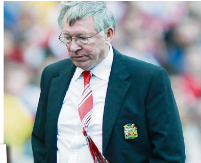
SLØSING MED TID: – Dra heller på biblioteket og les en bok, sier Alex Ferguson.